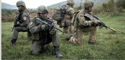
Internationale Zusammenarbeit Die Unterstützung beim Kapazitätsaufbau vor Ort ist auch ein zentraler Bestandteil der Missionen. Österreich ist bereit, seine militärischen Fähigkeiten in der Lage zu zeigen, wirkungsvolle Beiträge zur Lösung gemeinsamer Sicherheitsaufgaben zu leisten.

Die aktuellen Maßnahmen des Bundesheeres in der Region (siehe auch Infos auf der rechten Seite) umfassen vor allem den Beitrag zur militärischen Stabilisierung von Bosnien und Herzegowina (BH) und die Kosovo (KOS). Die Mission EUFOR Althea in BH, an der sich Österreich mit rund 300 Soldatinnen und Soldaten beteiligt, hat insbesondere die Stabilisierung der militärischen Aspekte der Friedensabkommen von Dayton und Paris und die permanente militärische Präsenz zum Auftrag, um eine neuzeitliche Gefährdung des Friedens zu verhindern. Die Aufträge des aktuell rund 430 Soldaten umfassenden österreichischen Beitrags bei der NATO-Mission der Kosovo International Security Force (KFOR) umfassen unter anderem die Gewährung der öffentlichen Sicherheit und Ordnung, die Unterstützung von internationalen Organisationen sowie Unterstützung beim