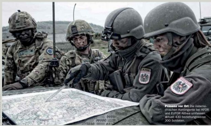
Pläne vor Ort Die Sicherheitsmissionen der KFOR und EUFOR Althea umfassen über 300 Soldaten.

Österreich engagiert sich seit vielen Jahren militärisch am Westbalkan. Aus gutem Grund, sind Sicherheit und Stabilität in der Region doch Grundvoraussetzungen für ein sicheres Europa.